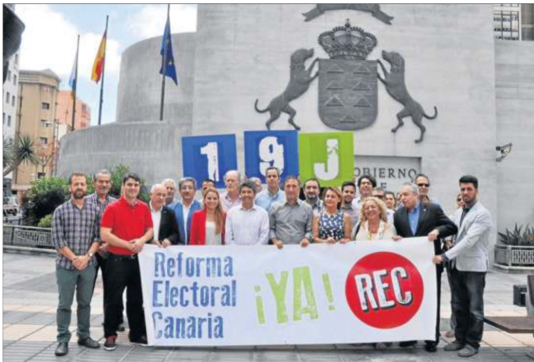
Por el cambio. Salvo CC y PSOE, prácticamente todas las fuerzas políticas del Archipiélago apoyan la manifestación para reformar el sistema electoral.