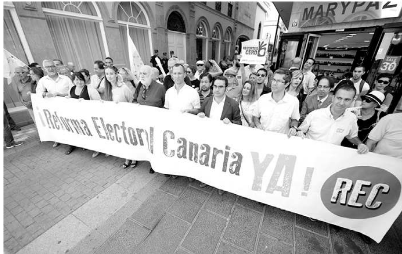
Concentración ante el Parlamento de Canarias para reivindicar un nuevo sistema electoral.

El manifiesto reivindica mejorar la proporcionalidad, incrementando la representación de las islas capitalinas (ahora el 17% de los canarios elige al 50% de los diputados), reducir las barreras electorales a una del 5% (el sistema vigente exige a un partido tener el 30% de los votos en una isla o el 6% regional para obtener escaños) y excluir como argumento principal de la reforma la triple paridad (el reparto equitativo de escaños por provincias, entre islas capitalinas, y entre estas y las no capitalinas).