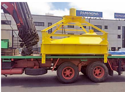
Imagen de la campana de Zamakona Yards en el Puerto de la Luz.

nalizada, de forma que se profundiza en la promoción de la prevención de la dependencia. En relación a los centros, el decreto amplía la definición de estos recursos no solo para las personas dependientes sino también para no dependientes. Es decir, personas válidas que por su situación personal o familiar se encuentren solas y necesiten residir en un centro. De igual forma los centros ocupacionales también podrán ahora atender a personas mayores. LOT