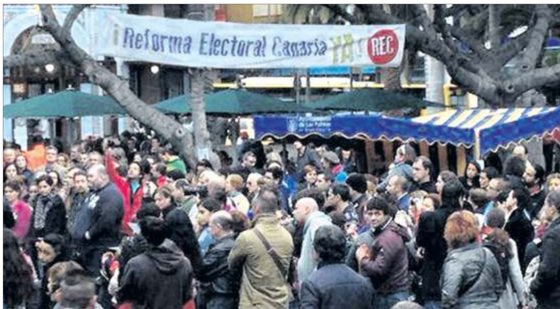
Movilizaciones. Demócratas para el cambio lleva desde junio desde 2007 convocando movilizaciones populares para pedir la reforma del sistema.

Elecciones 2015. La Plataforma Demócratas para el cambio ha reunido más de 6.000 firmas para trasladar al Consejo Europeo la reforma de las barreras electorales ➤ Los apoyos se han multiplicado desde los comicios