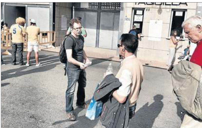
En el estadio. Miembros de Demócratas para el cambio repartieron octavillas antes del partido UD-Valladolid.

Desde Coalición Canaria, partido en el trono del Archipiélago durante los últimos 22 años, se esgrime que ya hay una propuesta de ley electoral enviada a las Cortes con la que se pretende rebajar los topes regionales e insulares, aunque bajo ningún concepto se plantean eliminar la triple paridad. Esa modificación resulta insuficiente para Demócratas para el cambio y los partidos que han decidido apoyar esta movilización. En concreto 16 formaciones, en las que algunas están intentando conseguir traer a Gran Canaria a alguno de sus referentes nacionales para que haga acto de presencia en la manifestación.