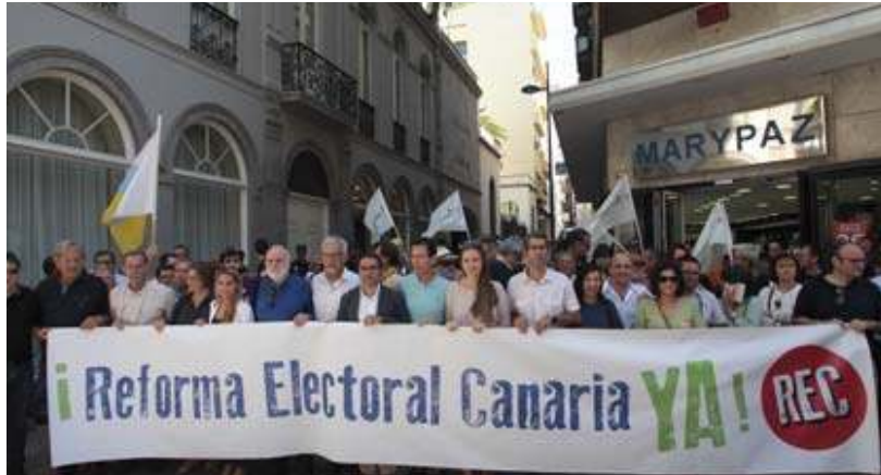
Imagen de la concentración que tuvo lugar ayer a las puertas del Parlamento regional.

En la concentración -a la que siguió una manifestación por las calles de Las Palmas de Gran Canaria- estuvieron representantes de partidos que obtuvieron representación parlamentaria, como Podemos y Nueva Canarias, y también de otros que han quedado