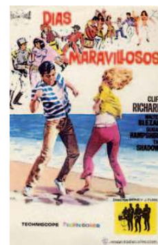
Cartel de 'Wonderful Life'.

Saavedra opinó que el Castillo de Mata deberá ser un museo de la ciudad que albergue cosas antiguas y criticó que al Castillo de la Luz, donde está la Fundación Martín Chirino, le quitan las vallas que lo protegen, pues son “la obra de unos arquitectos de nivel internacional y es una violación al derecho de autor”.