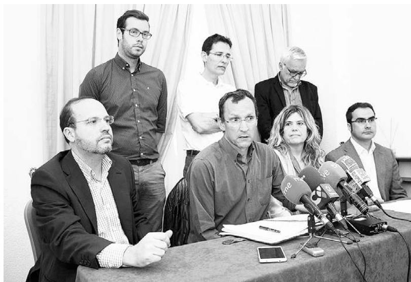
Representantes de partidos que exigen una reforma electoral, ayer, en rueda de prensa.