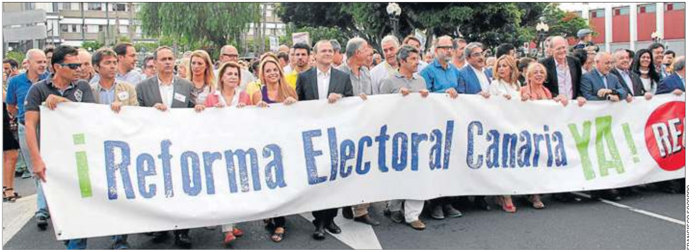
Protesta. Imagen de la manifestación del pasado viernes exigiendo un cambio en el sistema electoral.

Desequilibrio. PP, Podemos y NC exigen consenso para acabar con las disparidades del sistema electoral del Archipiélago ➤ Rodríguez y Santana señalan que ya trabajan en el seno de sus organizaciones en propuestas de ley