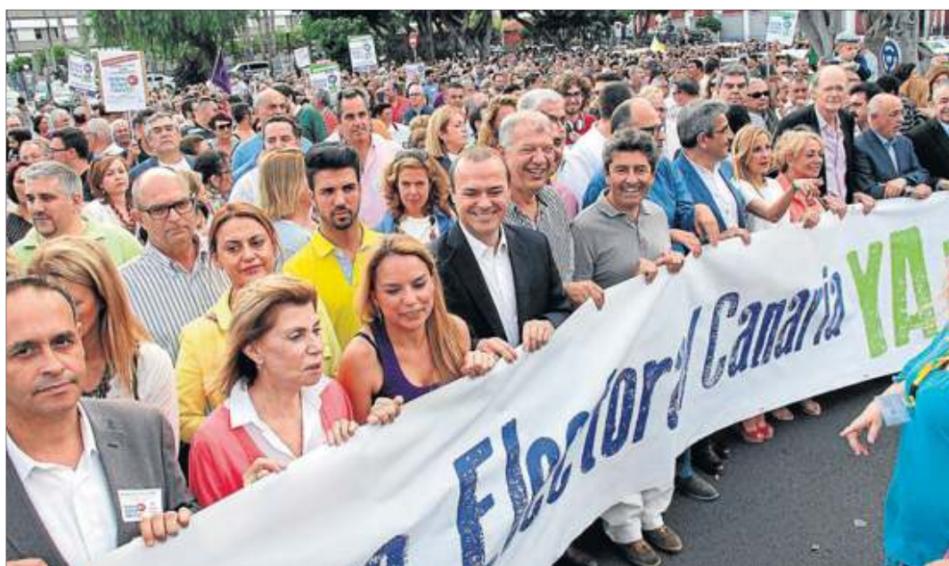
A la cabeza. La mayoría de los partidos políticos de Canarias, exceptuando Coalición Canaria, se manifestaron contra el sistema de triple paridad.

Poco más de hora y media de acto, desde la salida de la cabeza de la manifestación hasta el último grito de «reforma electoral ya». Pero con mucho contenido, un recorrido por cómo se han sucedido ocho legislaturas del Gobierno de Canarias sin que el sistema electoral haya pasado de una disposición transitoria vinculada al Estatuto de Autonomía. Ese fue uno de los puntos fuertes del manifiesto, que roga