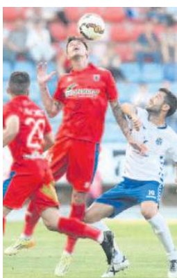
Un lance del encuentro.