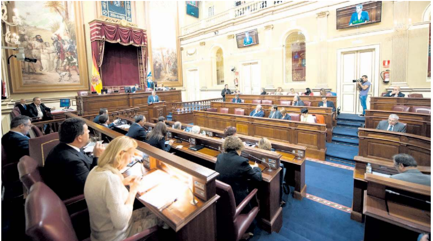
El Parlamento de Canarias, durante un pleno de la pasada legislatura; en la Cámara hay 60 elegidos por islas, según un reparto hecho con la regla de la triple paridad.

■ ELECCIONES 24M &gt; A VUELTAS CON EL DEBATE SOBRE EL SISTEMA ELECTORAL DEL ARCHIPIÉLAGO