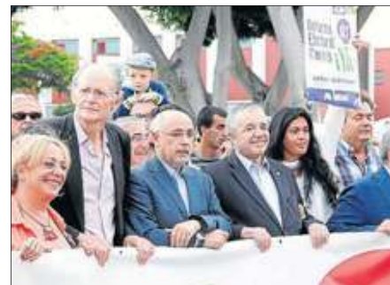
Manifiesto. El final de la convocatoria, ante la sede del Ejecutivo regional en Gran Canaria, dejó eslóganes contra la disposición transitoria que maneja el sistema electoral de las Islas.