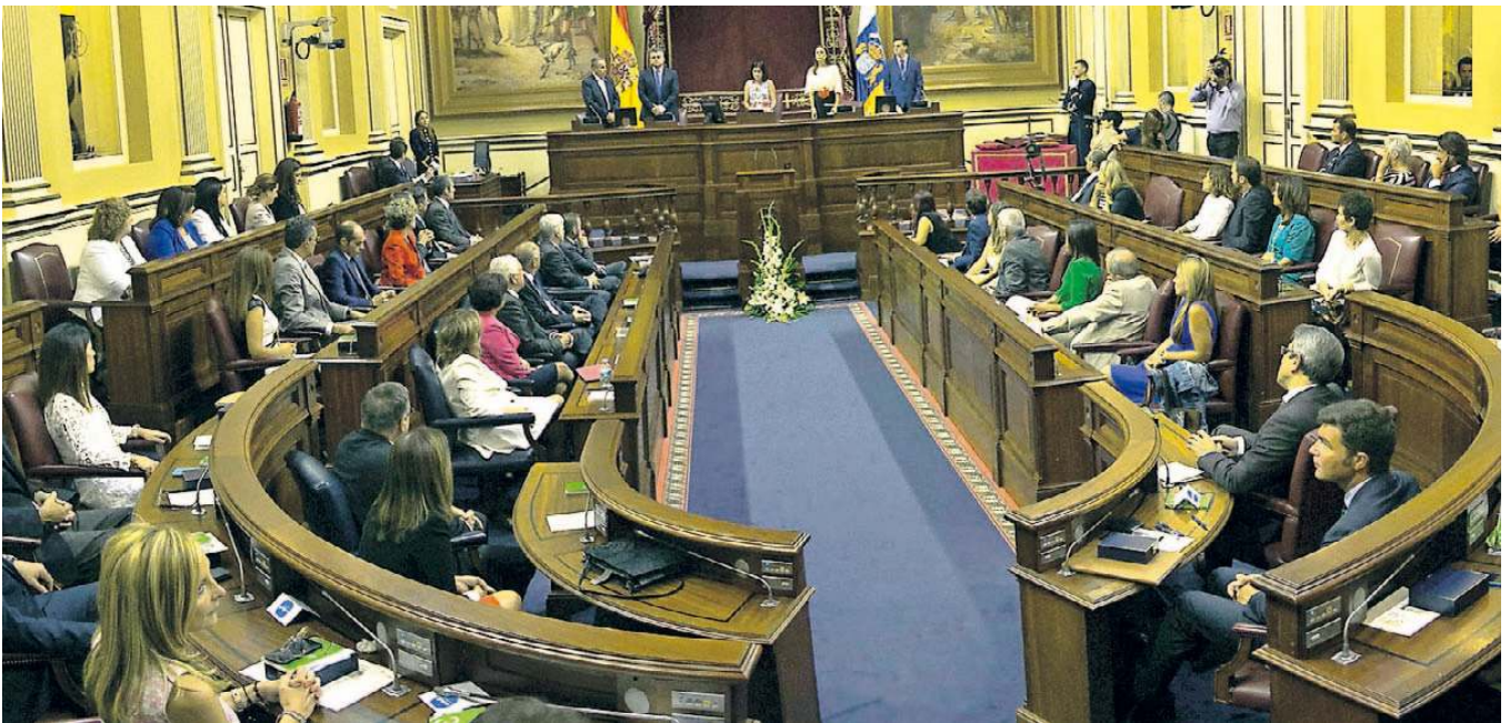
Imagen del pleno constitutivo de la IX Legislatura autonómica tras el nombramiento de los cinco miembros de la Mesa del Parlamento.