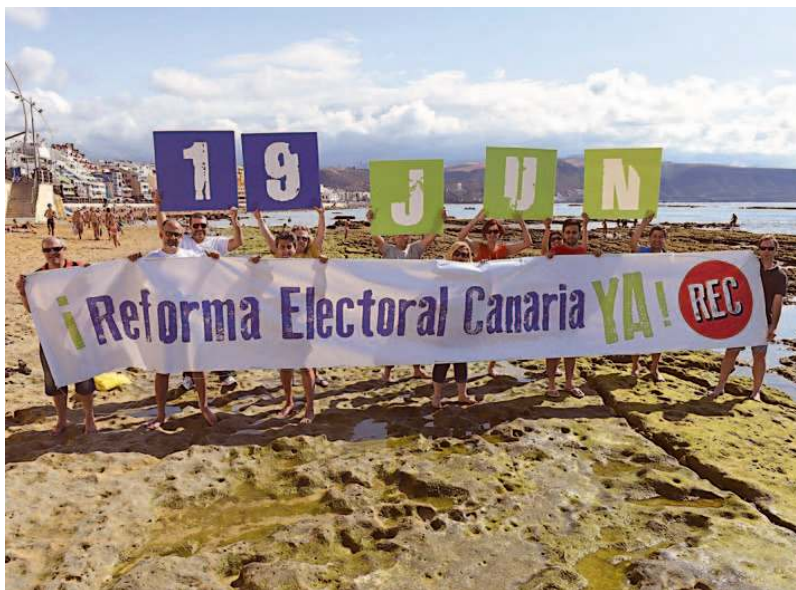
Miembros del Foro cívico Demócratas para el Cambio llaman a la manifestación del viernes desde Las Canteras. | A. C.

Yo siempre me he sentido avergonzado, al conversar con múltiples personalidades españolas y extranjeras, de la mala fama que tenemos los grancanarios por lo que respecta a nuestras relaciones con la isla de Tenerife. Es de dominio público la existencia entre ambas de una mala sana rivalidad en vez de una noble competencia. Y si a ello unimos que importantes personalidades del país habrían venido en conocimiento de que no éramos capaces de aprobar nuestro Estatuto de Autonomía por unas nuevas hostilidades, añadidas a las anteriores, en este caso por parte de las islas menores (salvo Lanzarote, ya que Ra-