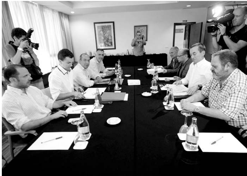
La mesa de negociación de CC y PP volvió a reunirse ayer en el santacrucero Hotel Escuela.

En todo caso, aseveró que "se da un paso más" al dado ya en la Ley de Armonización y Simplificación en vigor desde enero, que ya supuso la derogación de la anterior ley de impacto de 1999, para adaptar la legislación cana-