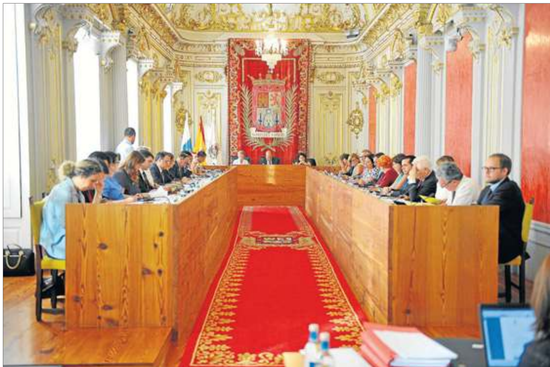
Instituciones. Imagen de archivo de un pleno del Ayuntamiento de Las Palmas de Gran Canaria.